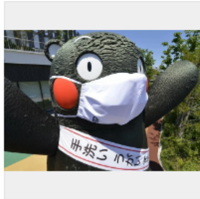
「くまモンは口呼吸？ 鼻呼吸？」 マスク姿になったサクラマチ クマ